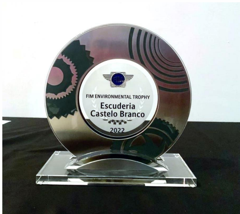
Atribuição Prémio Internacional FIM